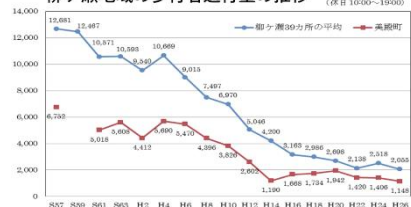
柳ヶ瀬地域の歩行者通行量の推移 (※日 10:00～19:00)

ボランティアスタッフとして、たくさんの地元の 学生さんが参加、地域みんなで盛り上げています。