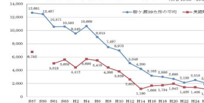
柳ヶ瀬地域の歩行者通行量の推移（平日10:00～19:00）